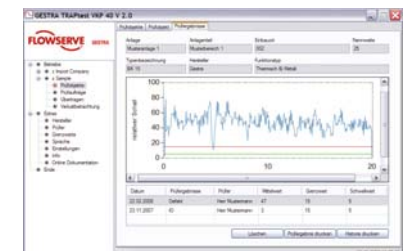
Die aufgenommene Schallkurve eines defekten Ableiters mit Dampfverlusten