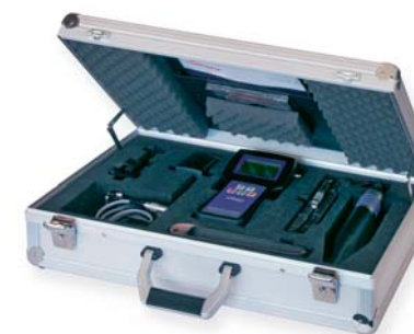
Praktischer Koffer für die Lagerung und den mobilen Einsatz

Nicht berücksichtigt sind in dieser Übersicht andere Folgen defekter Kondensatableiter, wie z. B. vorzeitiger Verschleiß von Rohren, gegenseitige Beeinflussung von funktionsfähigen und defekten Kondensatableitern etc.