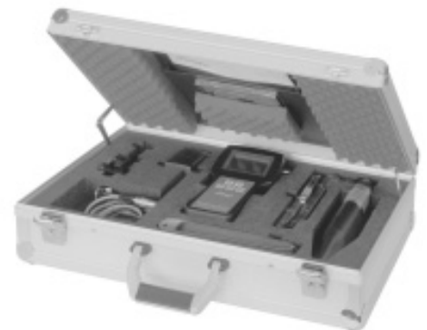
Servicekoffer TRAPtest VKP 40 bzw. VKP 40ex