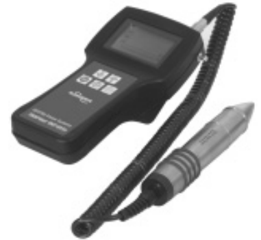
Datensammler VKPN 40ex mit Messwertaufnehmer VKPS 40ex