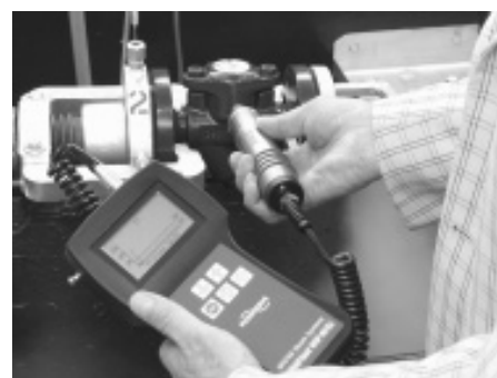
Prüfung eines Ableiters