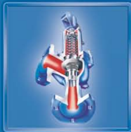
SAFE 903 Weichdichtung für Heizung