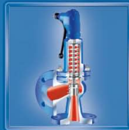
SAFE-P 921 für kleine Durchflussmengen