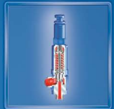
SAFE-TCP 961 / TCS 951 für hohe Drücke bis PN100