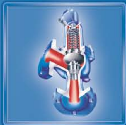
SAFE 901 Vollhub-Sicherheitsventil