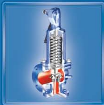
SAFE 901 ANSI Vollhub-Sicherheitsventil