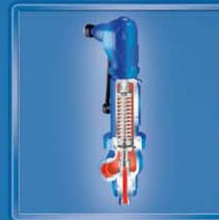
SAFE-TC 941 Gewindeanschlüsse